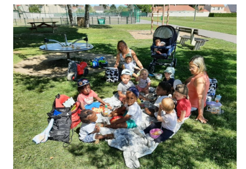
Pique-nique de fin d'année avant les vacances d'été