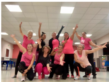
Soirée « Octobre Rose » pour la lutte contre le cancer du sein

Tous les mercredis de 19 h 30 à 20 h 30 et les jeudis de 19 h 00 à 20 h 00 à la salle Les Ormes. Renseignements : jmzumbas@gmail.com